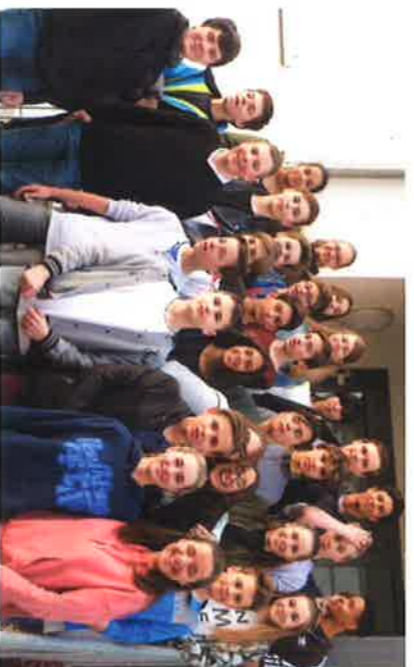
Französische Austauschklasse zu Gast am Campus Erbenheim