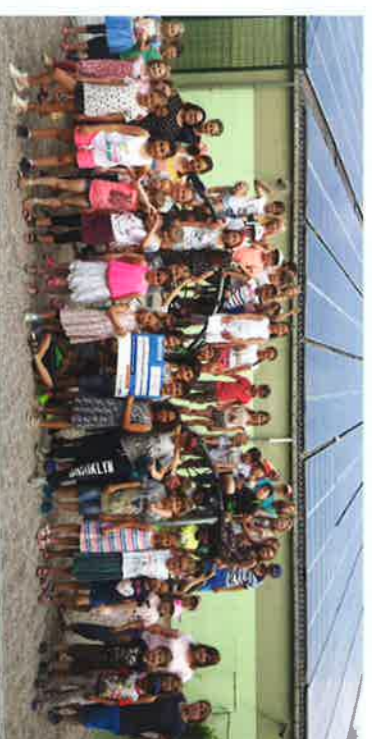
80 Kinder der Grundschule Rüsselsheim laufen für den guten Zweck

Der Campus Erbenheim startet ein Austauschprogramm mit der Schule »Collège Saint François d'Assise« aus Montpellier. Im September 2016 verbrachten deutsche Schülerinnen und Schüler eine Woche bei ihren Austauschpartnern und lernten das südfranzösische Flair kennen. Im April 2017 erfolgte der Gegenbesuch in Wiesbaden. Neben Unterrichtshospitationen standen auch Ausflüge auf dem Programm. Durch die Begegnung konnten die Jugendlichen ihre Sprachkenntnisse ausprobieren und das Nachbarland und seine Kultur kennen lernen.